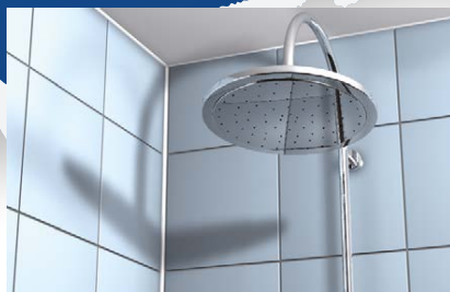
Giunzioni nei locali bagno