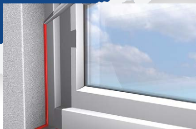
Sigillatura interna ed esterna di serramenti

Sigillante siliconico neutro a base alcoxi e a basso modulo, per l'installazione di serramenti.